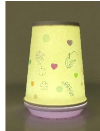
紙コップランタン